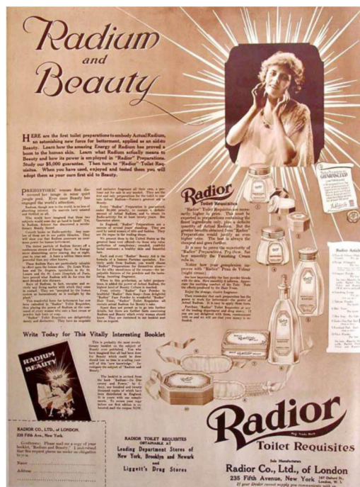
Figura 2 Publicidad de cosméticos Rador que muestra una gama completa de productos para el cuidado de la belleza femenina.

Además, es difícil imaginar cómo se podían manipular los productos radioactivos con los medios disponibles en aquellos años en los que no existían las normas de seguridad que hoy en día son obligatorias en la industria cosmética 8-9 .